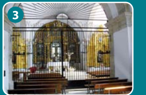
3 Ermita de la Virgen del Castillo