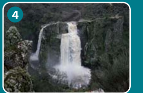
4 Pozo de los Humos