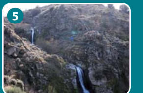
5 Pozo Ayrón

red de Espacios Naturales de Castilla y León