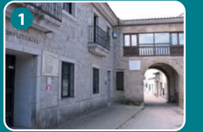
1 Ayuntamiento y El Arco